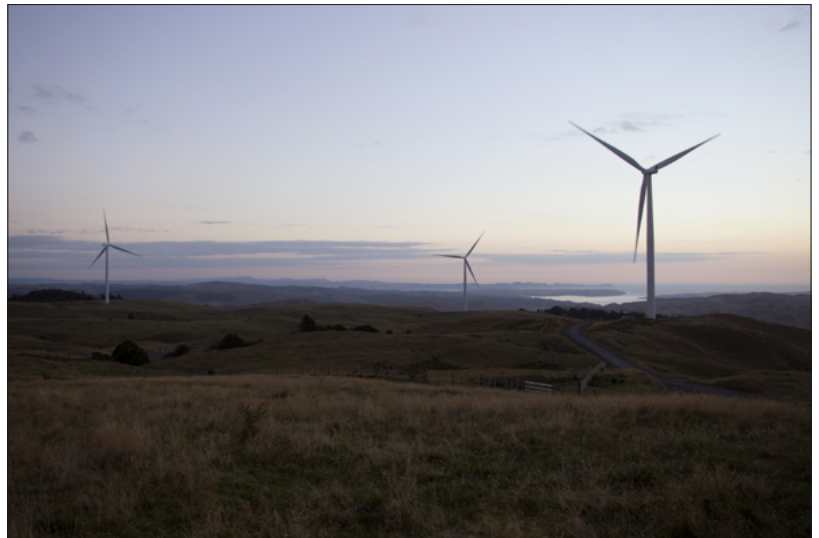
Windfarm in Neuseeland

Um jederzeit zu gewährleisten, dass die schwankende Residuallast abgedeckt wird, ist gegenwärtig die Einrichtung eines sog. Kapazitätsmarkts in der Diskussion. Befürworter erhoffen sich von einem solchen Markt ökonomische Anreize an die Stromversorger die Kraftwerkskapazitäten zu vermitteln, die für die Gewährleistung der Versorgungssicherheit erforderlich sind. 12 Kritische Stimmen heben hervor, dass die Aufnahme von Kohlekraftwerken in den Kapazitätsmarkt unvereinbar mit dem Ziel einer