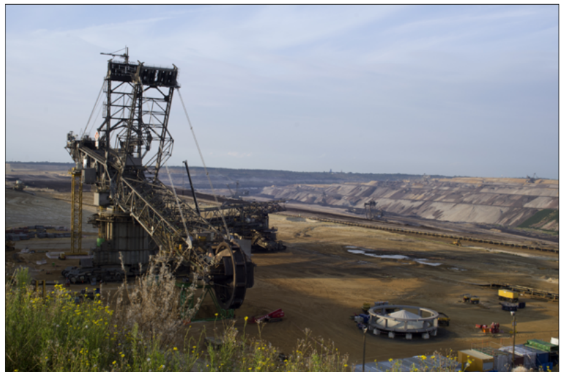
Braunkohletagebau im Rheinland

Es sind insbesondere Gaskraftwerke mit Gas- und Dampfturbinentechnik (GuD-Anlagen) die eine ausgeprägte Bandbreite an regelbarer Leistung und zugleich eine hohe Laständerungsgeschwindigkeit vorweisen. Mit dem Bau einzelner Braunkohle-Kraftwerksblöcke mit sogenannter „optimierter Anlagentechnik“ versuchen Kraftwerksbetreiber, die bislang grundlastorientierte Braunkohle-Verstromung der zukünftig steigenden Flexibilitäts-Anforderung anzupassen. Die breite Mehrheit der Bestandskohlekraftwerke bleibt jedoch auch weiterhin nur eingeschränkt