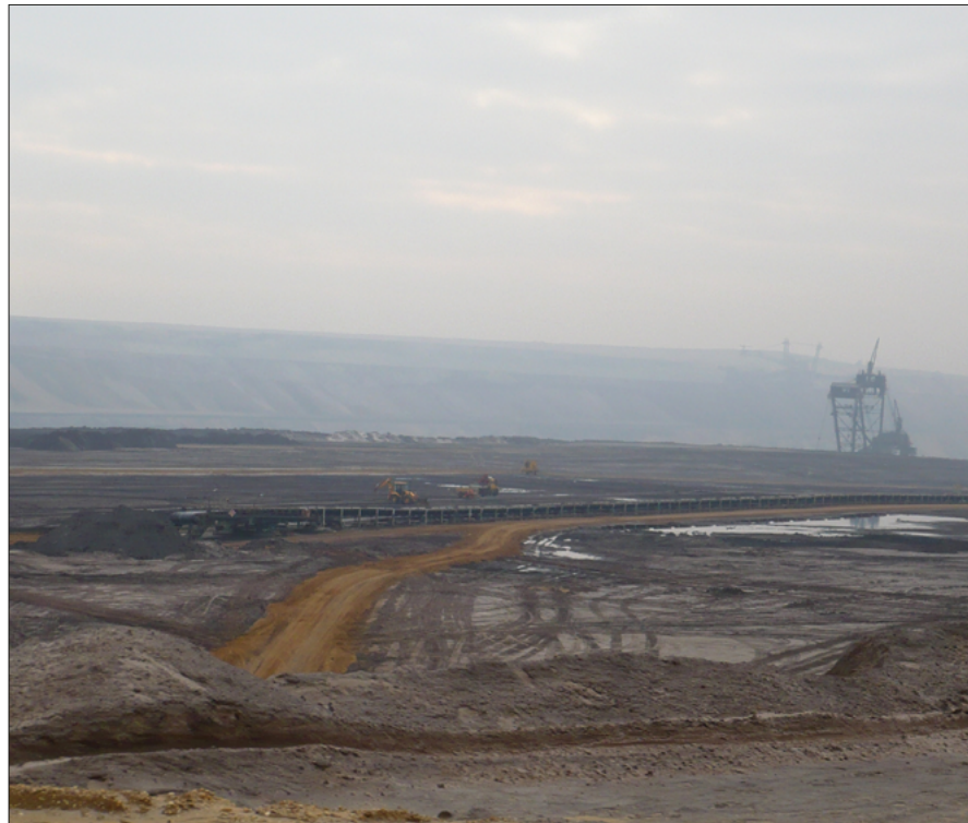
Braunkohletagebau Garzweiler

Noch bis vor wenigen Jahren ließen sich Kraftwerke der Stromerzeugung anhand der Kategorien Grundlast, Mittellast und Spitzenlast klassifizieren. Braunkohle- und Kernkraftwerke erfüllten die Funktion, die durchgängige Grundlast zu tragen, während mit Steinkohle die